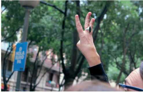
Martha Rosler, Votarem! Barcelona 1 October 2017 , 2020 (fotograma del vídeo). Vídeo, monocanal, color, sonido, duración: 10'.

y transición. Su trabajo permite analizar cada contexto sociopolítico partiendo de condicionantes geolocalizados que, a su vez, nos conducen a una reflexión de la que se extraen metodologías y estrategias globales, engendradas en el seno de una sociedad neoliberal y patriarcal. Como indica el título de la exposición, se incide en la necesidad de tomar consciencia de nuestro presente a partir de la suma de acontecimientos que construyen el pasado, único modo de entender de dónde venimos. Nos plantea un interrogante en torno al tiempo y al lugar. Sus obras se presentan como testimonios de ese pasado que, en muchos aspectos, aún nos acompaña. A su vez, «¿Cómo llegamos allí desde aquí?» incide doblemente en esa multiplicidad de significados que albergan sus trabajos. Martha Rosler realiza un giro espacio temporal y nos plantea cómo es posible cambiar de geografía y de época, y, en cambio, seguir generando imágenes que parecen formar parte de una misma localización, ¿pasado o presente continuo?