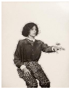
Esther Ferrer, Elle était là , 1994. Fotografía en blanco y negro intervenida con rotulador negro sobre papel, 91x72 cm. Es Baluard Museu d'Art Contemporani de Palma. © de la obra, Esther Ferrer, vegap, Illes Balears, 2021.