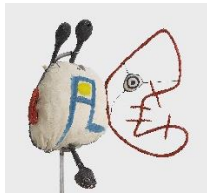
Joan Miró, Le Chien d'Ubu , ca. 1977 (detalle). Pintura, tela y materiales diversos, 184x80x22 cm. Es Baluard Museu d'Art Contemporani de Palma, depósito colección Govern de les Illes Balears. © de la obra, Successió Miró, 2021.