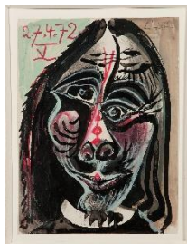
Pablo Picasso, Tête d'Homme (Mousquetaire) , 1972. Gouache, lápiz y lápices de colores sobre cartón, 28,7 x 21,2 cm. Colección particular. © Sucesión Pablo Picasso, VEGAP, Madrid, 2021.