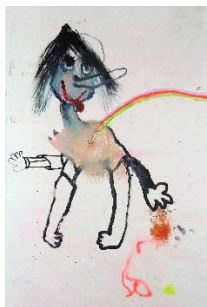
Bel Fullana, Pinocha , 2017. Óleo, acrílico y espray sobre lienzo, 290x190 cm. Es Baluard Museu d'Art Contemporani de Palma. © de la obra, Bel Fullana, 2021.