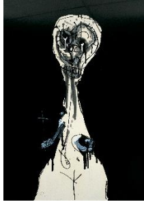
Antonio Saura, Doña Jerónima de la Fuente , 1972. Técnica mixta sobre papel, 100x70 cm. Es Baluard Museu d'Art Contemporani de Palma, donación Fundació d'Art Serra. © Antonio Saura: © Succession Antonio Saura / www.antoniosaura.org / A+V Agencia de Creadores Visuales 2021. Fotografía: David Bonet