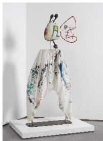
Joan Miró, Le Chien d'Ubu , ca. 1977. Pintura, tela y materiales diversos, 184x80x22 cm. Es Baluard Museu d'Art Contemporani de Palma, depósito colección Govern de les Illes Balears. © de la obra, Successió Miró, 2021.