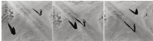
Shirin Neshat, Serie «Fervor» (Couple at Intersection), 2000. Gelatina de plata, 119,5x152,5 cm c/u. Edición: 5/5. Es Baluard Museu d'Art Contemporani de Palma, depósito colección particular. © de la obra, Shirin Neshat, 2021.