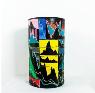
mounir fatmi, The Point of no Return [El punto de no retorno], 2022. Cerámica, 37,5 cm alt x 21,5 cm Ø, peana con pintura negra mate 30x30x80 cm, vitrina de metacrilato. Cortesía del artista. © Mounir Fatmi, VEGAP, Balears, 2022