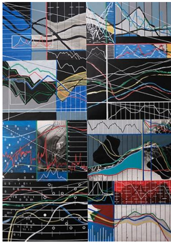
Mounir Fatmi, Before the Storm [Antes de la tormenta], 2022. Acrílico sobre papel. Serie de 12 pinturas, 84x118 cm c/u. Cortesía del artista. © Mounir Fatmi, VEGAP, Balears, 2022