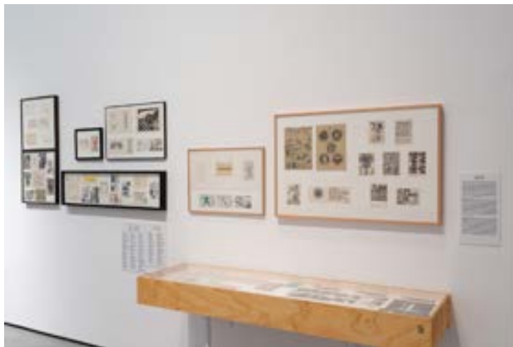
«Mira a veure si... Poesia experimental i mail art a Mallorca»

L'any començava amb quatre exposicions inaugurades en el darrer trimestre de 2020, i és a finals del mes de març que s'ha presentat la primera exposició del 2021, a l'espai C, titulada «Memòria de la defensa: Arquitectures físiques i mentals». Comissariada per Imma Prieto i Pilar Rubí té com objectiu obrir una reflexió des de la nostra contemporaneïtat al voltant a la necessitat d'introduir elements arquitectònics, físics i mentals per tal de justificar accions polítiques que auguren protecció. L'exposició organitzada en tres àrees diferenciades aprofundeix en la dicotomia que plana sobre els motius pels quals es construeixen estructures de defensa. Allò del que solem defensar-nos no té res a veure amb l'agressió física, sinó més aviat amb la por que provoca la proximitat i l'assimilació d'idees alienes o, més ben dit, amb allò que pot modificar les nostres maneres de pensar i de fer. Mitjançant obres de Juan Genovés, Peter Halley, Lida Abdul, Marwa Arsanios, Daniela Ortiz, Wolf Vostell, Roy Dib, Jorge García, Maria Jesús González & Patricia Gómez, Antoni Muntadas, Mounir Fatmi, Petrit Halilaj i Kemang Wa Leuhelere, i plànols de diferents èpoques i iconografies diverses, a més d'una sèrie de documents procedents, majoritàriament, de l'Arxiu Intermedi Militar de Balears, també el fresc de la Conquesta de Mallorca (s. XIII), reproduït per primera vegada per a l'exposició. En un moment en què els