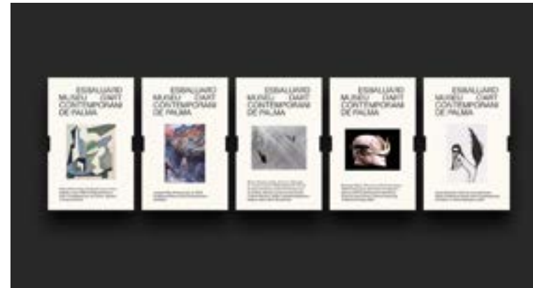
Entrades del museu

La llibreria del Museu segueix donant prioritat als llibres. En aquest sentit s'han organitzat durant l'any: Punt de llibre, i el dia de llibre (aquest any també es va participar a la versió on-line del bookcrossing organitzat per la Biblioteca d'Artium) i la campanya #LlegimJuntxs