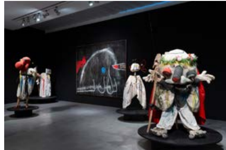
«Personae. Màscara contra la barbàrie»