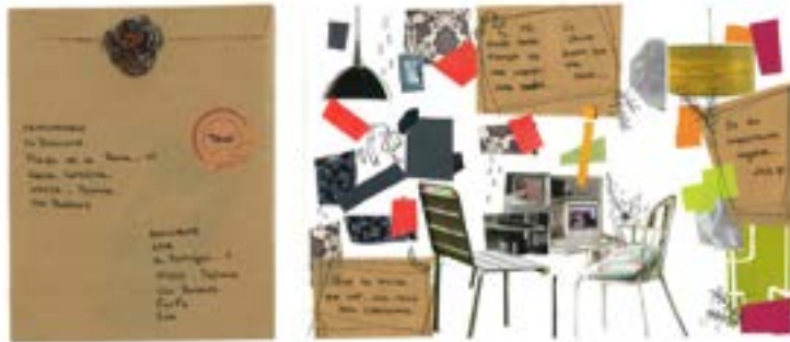
Mailart per centres educatius.

Pel que fa a Programes Públics, les activitats físiques presencials, varen reprendre progressivament el pols habitual amb l'aixecament de les mesures restrictives a causa de la COVID-19. Aquest provocà que moltes cites previstes pel 2020 s'haguessin d'ajornar desembocant en l'any següent. És el cas del programa «Institut de Corpologies deslocalitzades, I-CorDes», amb el suport de la Conselleria de Fons Europeus, Universitat i Cultura del Govern de les Illes Balears, que ha comptat amb cinc sessions, enlloc de les quatre previstes anualment. S'ha continuat apostant per una iniciativa pionera a Balears pel que fa als llenguatges del cos i el moviment des d'un triple vessant teòric, pràctic i sonor que ha comptat amb destacats professionals com Mónica Valenciano, Isabel de Naverán i Mariantònia Oliver entre molts i moltes altres. En aquest sentit, s'ha iniciat també un cicle de performance amb Itziar Okariz, que vinculat a l'exposició de col·lecció Personae, seguirà el seu camí durant 2022.