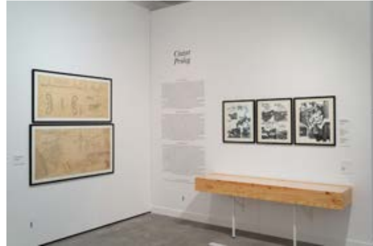
«La utopia paralela. Ciutats somiades a Cuba (1980-1993)»