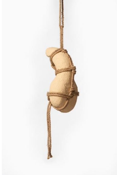
Nauzet Mayor, Sin título , 2022. Talla de poliestireno expandido con revestimiento de piedra artificial y cuerda, medidas variables. Cortesía del artista. © de la obra, Nauzet Mayor, 2023. Fotografía: David Bonet