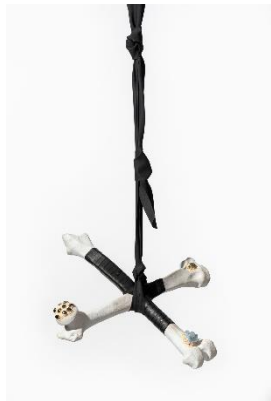
Nauzet Mayor, Sin título , 2022. Cerámica modelada a mano, hematitas, pirita, cuarzo azul, cinta de tenis y goma de fitness , dimensiones variables. Cortesía del artista. © de la obra, Nauzet Mayor, 2023. Fotografía: David Bonet