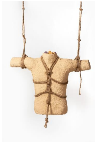
Nauzet Mayor, Sin título , 2022. Talla de poliestireno expandido con revestimiento de piedra artificial, cuerda, cuarzo de color naranja y amatista, medidas variables. © de la obra, Nauzet Mayor, 2023.