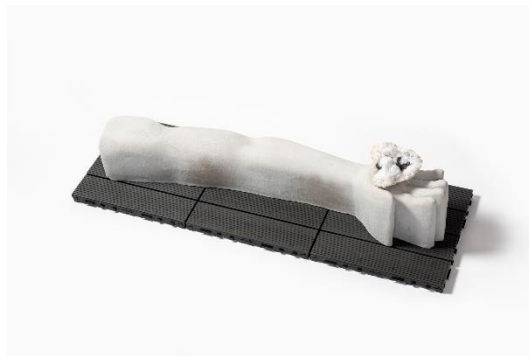
Nuzet Mayor, Sin título , 2022. Cerámica modelada a mano, cuarzo, hematitas y tarima de polipropileno, medidas variables. Cortesía del artista. © de la obra, Nuzet Mayor, 2023. Fotografía: David Bonet