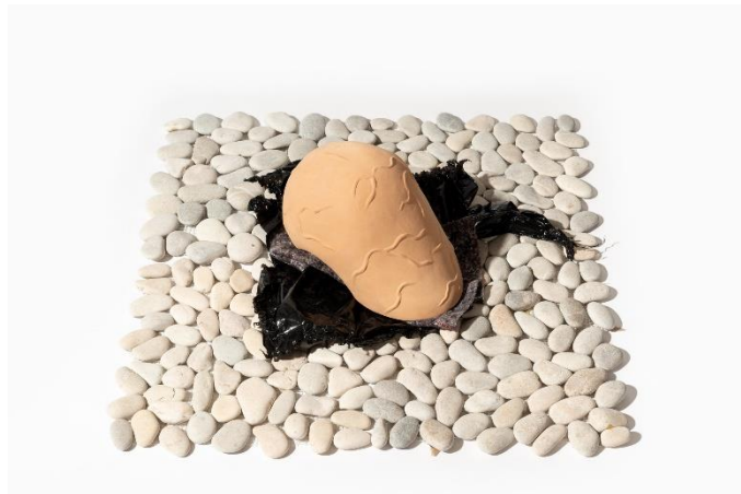
Nauzet Mayor, Sin título , 2022. Cerámica modelada a mano, manta, plástico y cantos rodados, medidas variables. Cortesía del artista. © de la obra, Nauzet Mayor, 2023. Fotografía: David Bonet