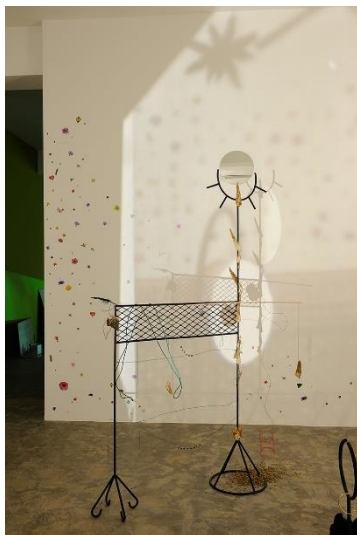
Dineo Seshee Bopape, Reneilwe (we are given) . De la instal·lació «Sedibeng, (It comes with the rain)», 2016. Acer pintat, filferro, corda, herbes, amulets, plomes, fusta, adhesius de vinil, mirall, estructura, 223 x 128 x 40 cm, mirall 34 x 0,6 cm. Edició: 3 + 2 P.A. Es Baluard Museu d'Art Contemporani de Palma,