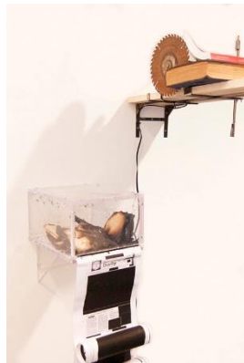
Voluspa Jarpa, De los artilugios cotidianos [Dels artefactes quotidians], 2015. Llibres, documents impressos, eines diverses, motor. Col·lecció particular. © de l'obra, Voluspa Jarpa, 2023.