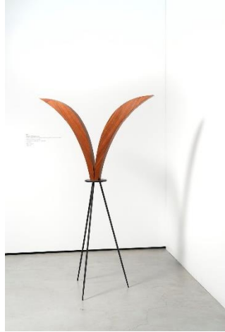
Iman Issa, Heritage Studies #7 [Estudis del patrimoni #7], 2015. Fusta, fusta pintada i text en vinil, 198 x 60 x 48 cm. Edició: 1/3 + 2 P.A. Es Baluard Museu d'Art Contemporani de Palma, dipòsit col·lecció Juan Bonet. © de l'obra, Iman Issa, 2023.