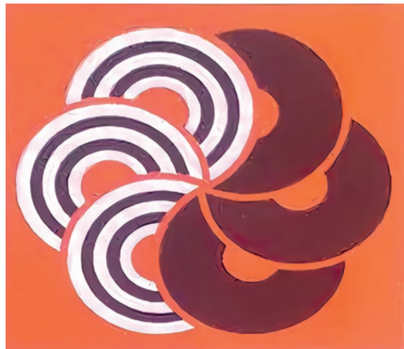
Carles Congost, Albatros (Memorabilia) , 2023. Fotografia en color, mides variables.