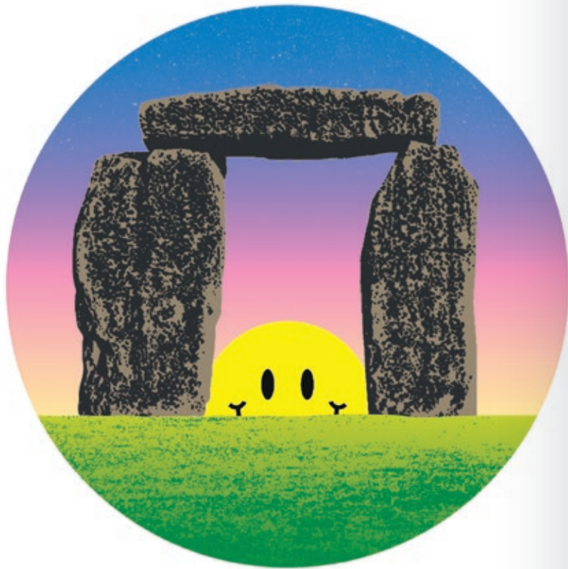
Jeremy Deller, New Dawn [Nova albada], 2023. Pòster, dimensions variables.