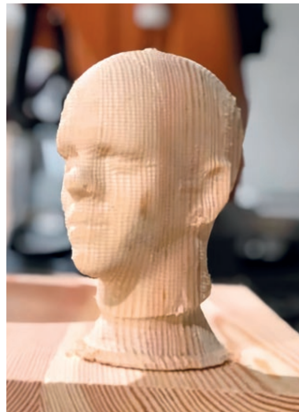
Carles Congost, Noi de província (Smalltown Boy) (en procés), 2023. Fusta, cordes de niló, vernís. Cortesia de l'artista