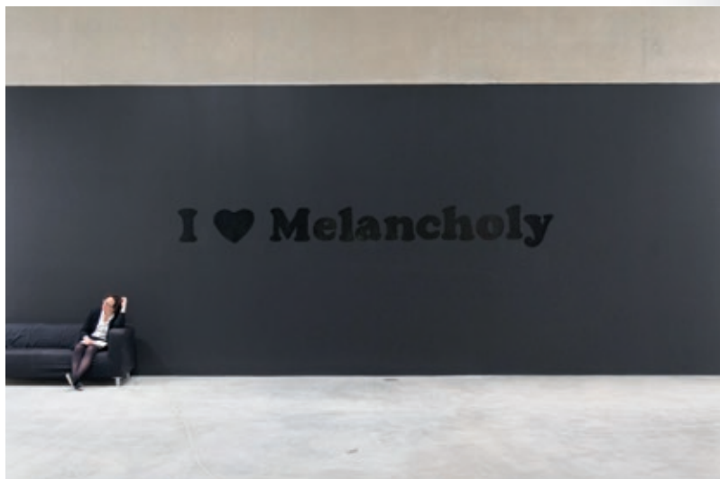
Jeremy Deller, I ♥ Melancholy [Jo ♥ Malenconia], 1993. Pintura negra brillant damunt paret pintada de color negre mat, amb un participant, dimensions variables. Vista de l'exposició «Joy In People», Contemporary Art Museum, St. Louis, 2013.