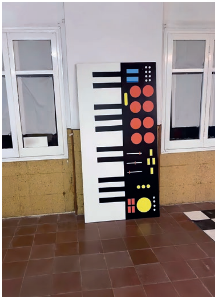
Carles Congost, Keyboard [Teclat], 2023. Tècnica mixta.

Music as a Foreign Language Carles Congost i Jeremy Deller