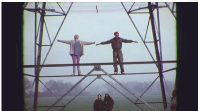
Jeremy Deller, Everybody in the Place: An Incomplete History of Britain 1984-1992 , [Tota la gent. Una història incompleta de la Gran Bretanya 1984-1992], 2018. Vídeo HD, monocanal, color, so. Durada: 61' 35". Edició de sis. Cortesia de l'artista i The Modern Institute / Toby Webster Ltd., Glasgow