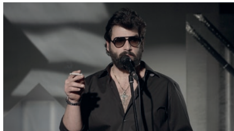
Carles Congost, Abans de la casa / Un biopic inestable a través del sonido Sabadell , [Abans de la casa / Un biopic inestable a través del so Sabadell], 2015 (fotograma del vídeo). Vídeo HD 4K, monocanal, color, so. Durada: 22'.