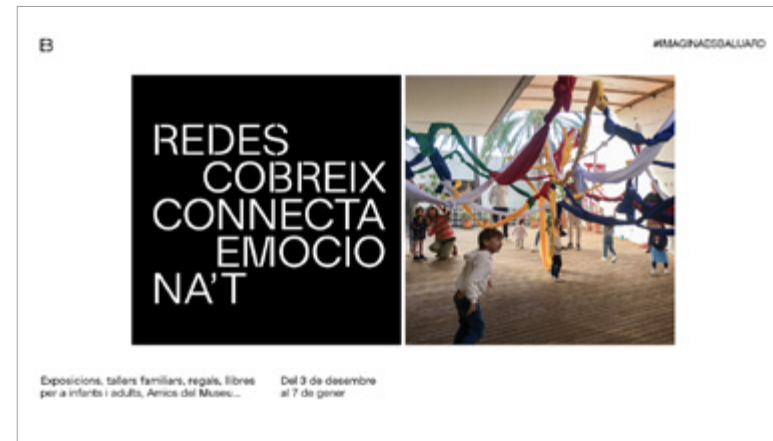
Campanya: «Nadal 2023-2024»