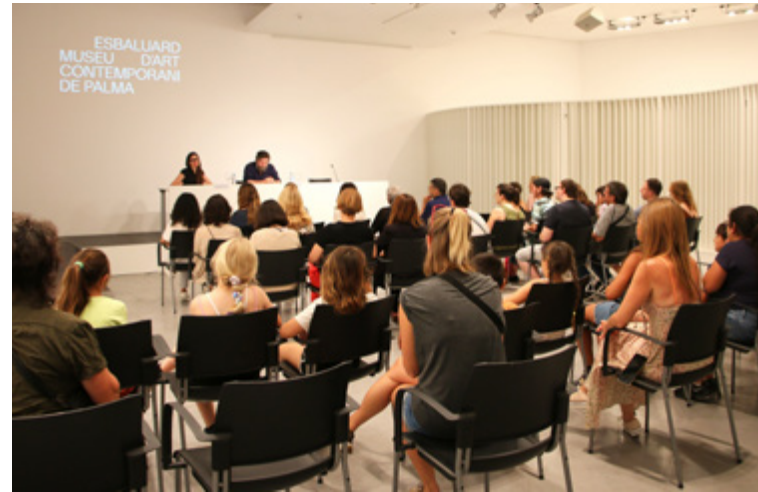
Roda de Premsa «Peciro G. Romero. A d'Arxipeleg»