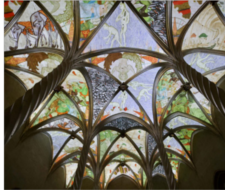
Mapping Cartografia de l'Imaginarí L'Atlas de Cresques Abraham (La Llotja de Palma)

El Programa d'Amics d'Es Baluard Museu ofereix la possibilitat d'acostar-se al Museu d'una forma especial. S'ofereixen activitats especials i exclusives: visites pre-inaugurals de la mà dels comissaris i artistes de les exposicions; descomptes en la inscripció a les diferents activitats del museu, descomptes en la llibreria, etc.