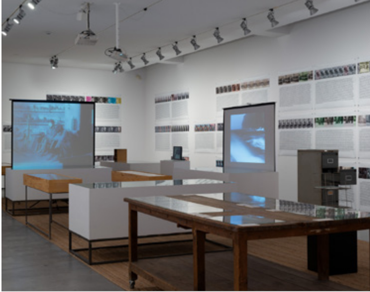
«Pedro G. Romero. A d'arxipèlag»

Des de l'Àrea Artística, l'edició de la publicació de l'exposició de Maria Lai prevista al Pla d'Actuació no va ser realitzada per motius pressupostaris. En canvi, sí es va dur a terme el llibre vinculat a la mostra temporal «Jorge Eduardo Eielson. El nus vertical», edició realitzada conjuntament amb el TEA Espacio de las Artes de Tenerife, en dos idiomes, espanyol i anglès. La versió digital en català està prevista per a principis de 2024.