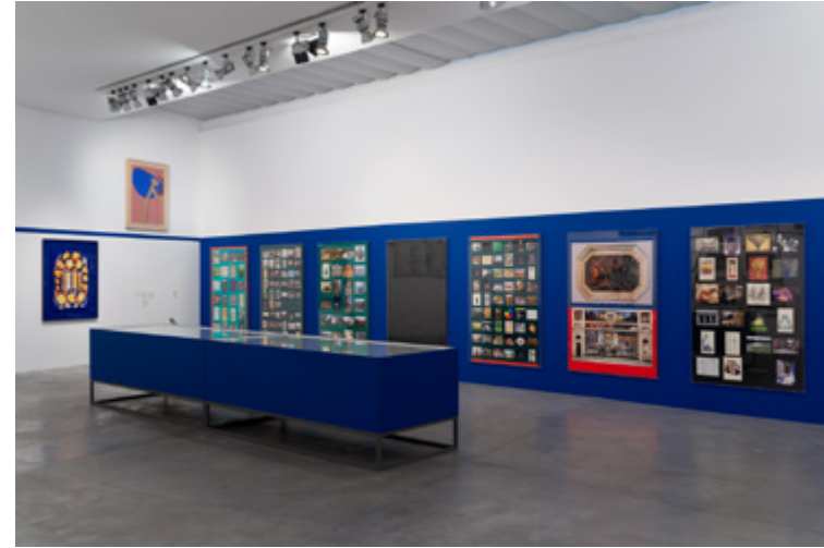
«Sin Rumbo. Confrontar la Imago Mundi»