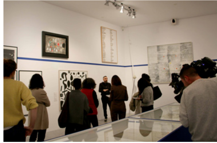
Roda de Premsa «Sense Rumb. Confrontar la Imago Mundi»