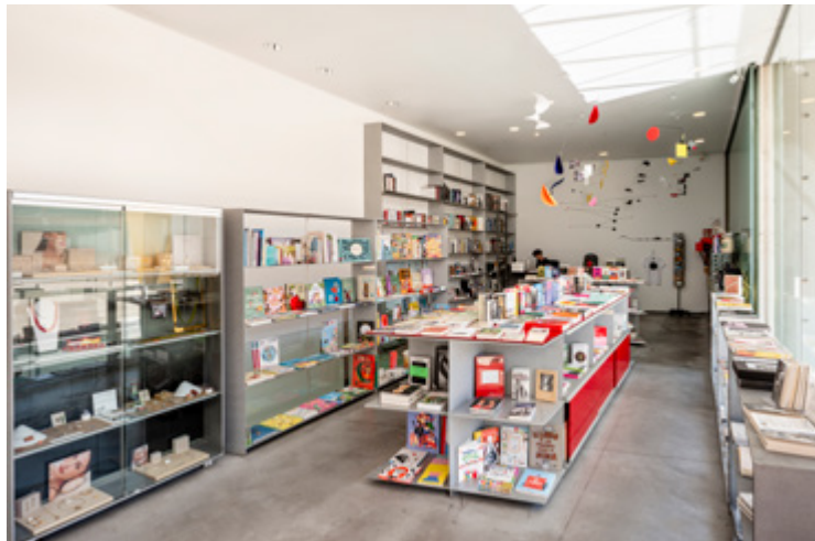
Libreria Es Baluard Museu

La Llibreria d'Es Baluard Museu es consolida com a punt de referència. A més de l'ampli ventall de llibres i productes, s'organitzen diferents actes i programes propis: presentacions de llibres, activitats específiques com la del dia de llibre (aquest any també es va participar a la versió on-line del bookcrossing organitzat per Artium), entre d'altres.