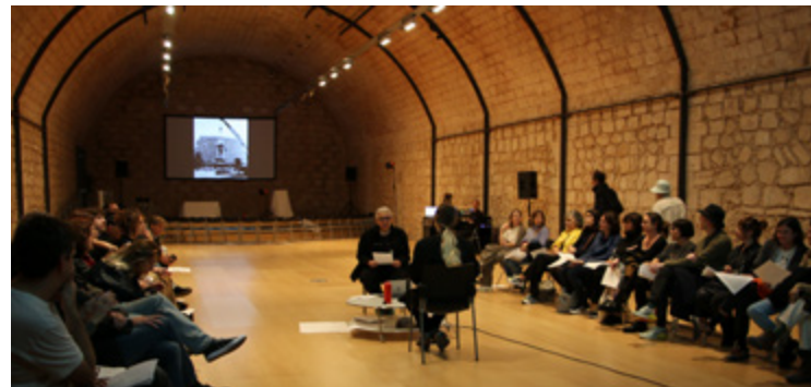
Performance «El bicho» de Dora García