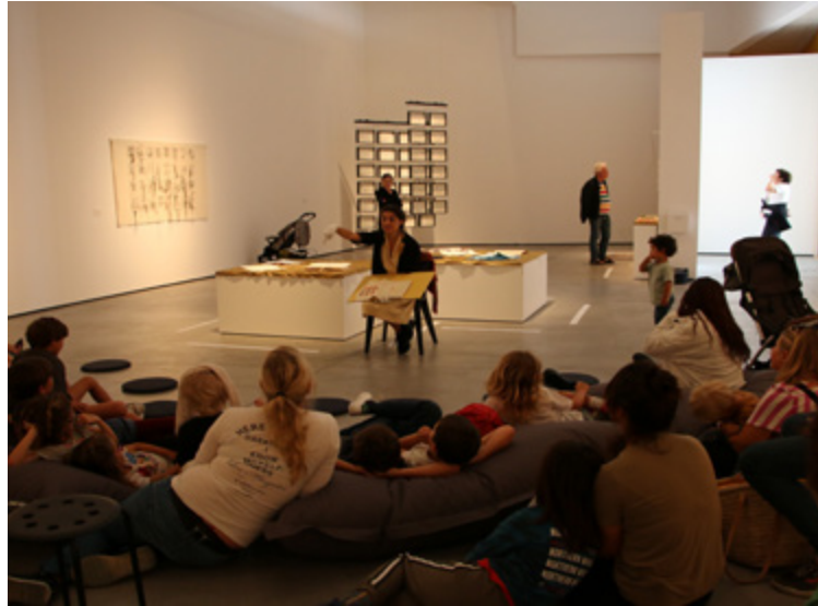
Activitat familiar: «Fila que fila... històries i jocs»

S'han sumat a aquests formats, projeccions de pel·lícules i documentals directament relacionats i/o creats pels propis artistes.