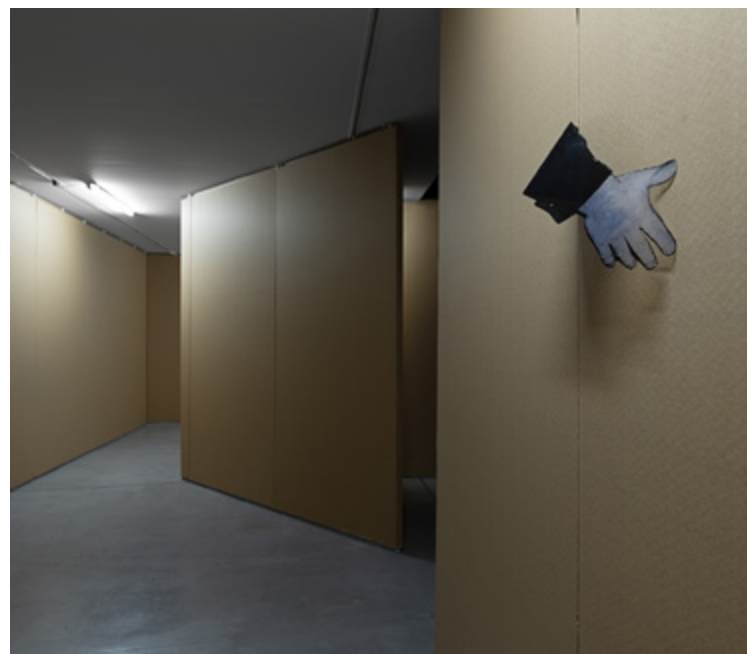
«Ian Waelder. Even in a language that is not your own»