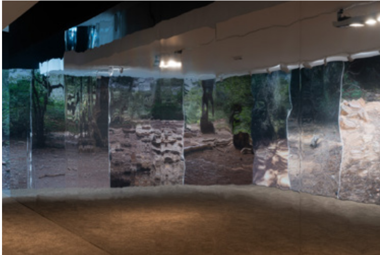
«Álvaro Perdices: Camins d'horabaixa. Iniciació al bosc»

la seva obra i els cossos dels visitants que entraven en l'espai creat dins la sala amb una membrana tensionada, permetent apropar-se al detall microscòpic, al gest brut i al fluid constant que connectava els objectes exposats.