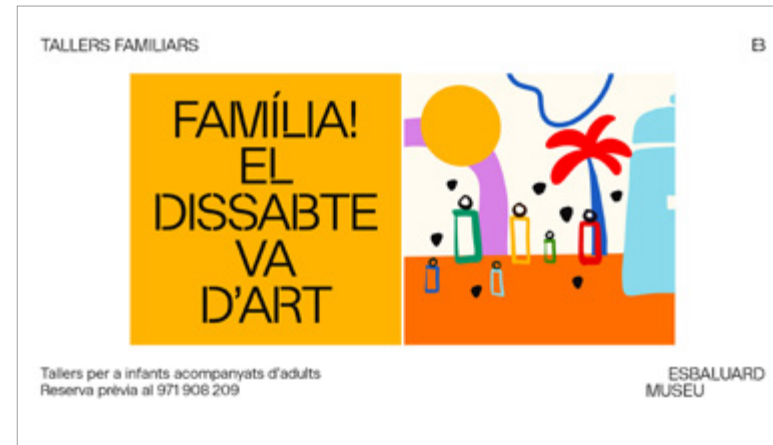
Campanya: «Famíliar El dissabte va d'art»