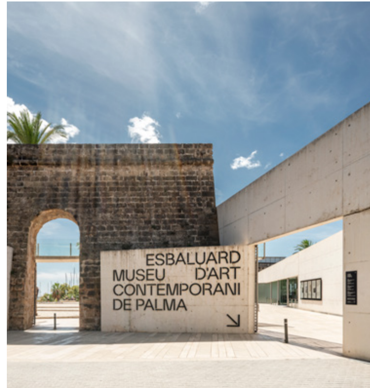
Es Baluard Museu