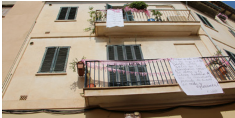
Projecte Feim Barri. Intervenció a l'espai públic