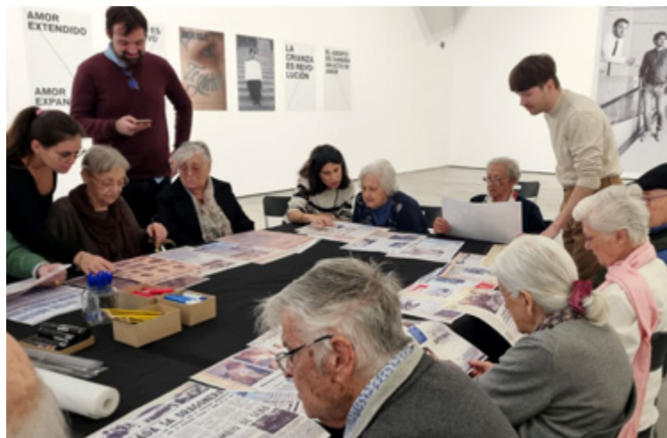
Projecte amb Gent Gran: «El Centenni»