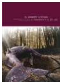
El turment i l'èxtasi