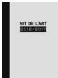
Nit de l'Art 2012/2017