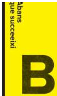
B #0 Abans que succeeixi